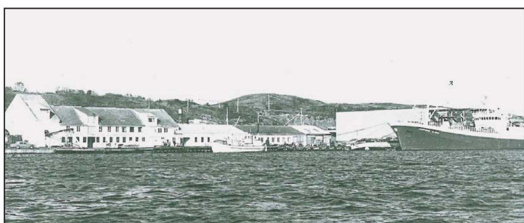
Fabrikkdrift på Rørvik var i mange år synonymt med hermetikk av sjøprodukter. Fabrikken hadde flotte navn som Rørvik Preserving, Bergen Packing, Shellfish Canning Company og Northern Packing. Den siste startet i 1955, men lokalene brant ned i 1981. Siden 1983 har Rørvik Fisk & Fiskmatforretning drevet i nybygde lokaler her.

Når kommunestyret ikke så at Rørvik kom til å bli bygdas senter, hang det trolig sammen med at de ikke ønsket at det skulle skje. Sammensetninga av kommunestyret, med et flertall av representanter fra Mellom- og Ytter-Vikna, gjorde også at man ikke satset på Rørvik. Fra Vikna ble egen kommune i 1869 og fram til 1888 var ikke Rørvik representert i kommunestyret.