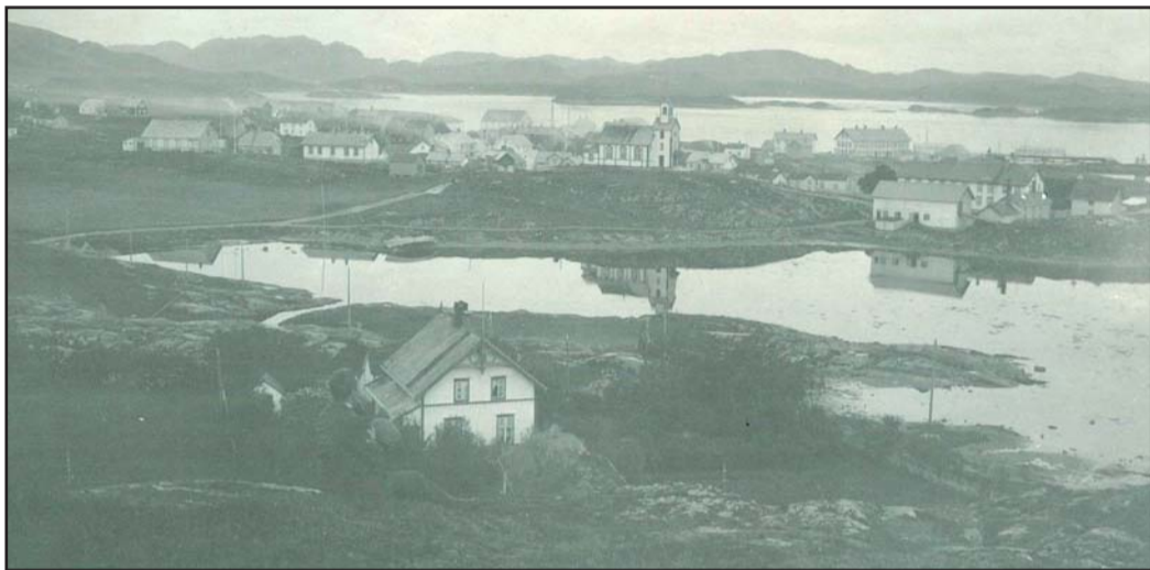
Huset i forgrunnen er Nærøysund Telegrafstation som åpnet 14.12.1876. Byggearbeidet startet i juni samme året, og huset kostet vel 11.000,- kr. I tillegg ble det bygd telegraflinje fra Namsos til Rørvik, og den kostet vel 64.000,- så den totale investeringa var betydelig. Bildet er tatt ca 1920. Televerket/Telenor har siden 1876 vært til stede her, og i dag er Telenor-Mobil en av de største arbeidsplassene i kommunen.

I 1863 ble ekspederinga av dampskipene som hadde gått langs kysten her siden 1838, flyttet fra Kråkøya til