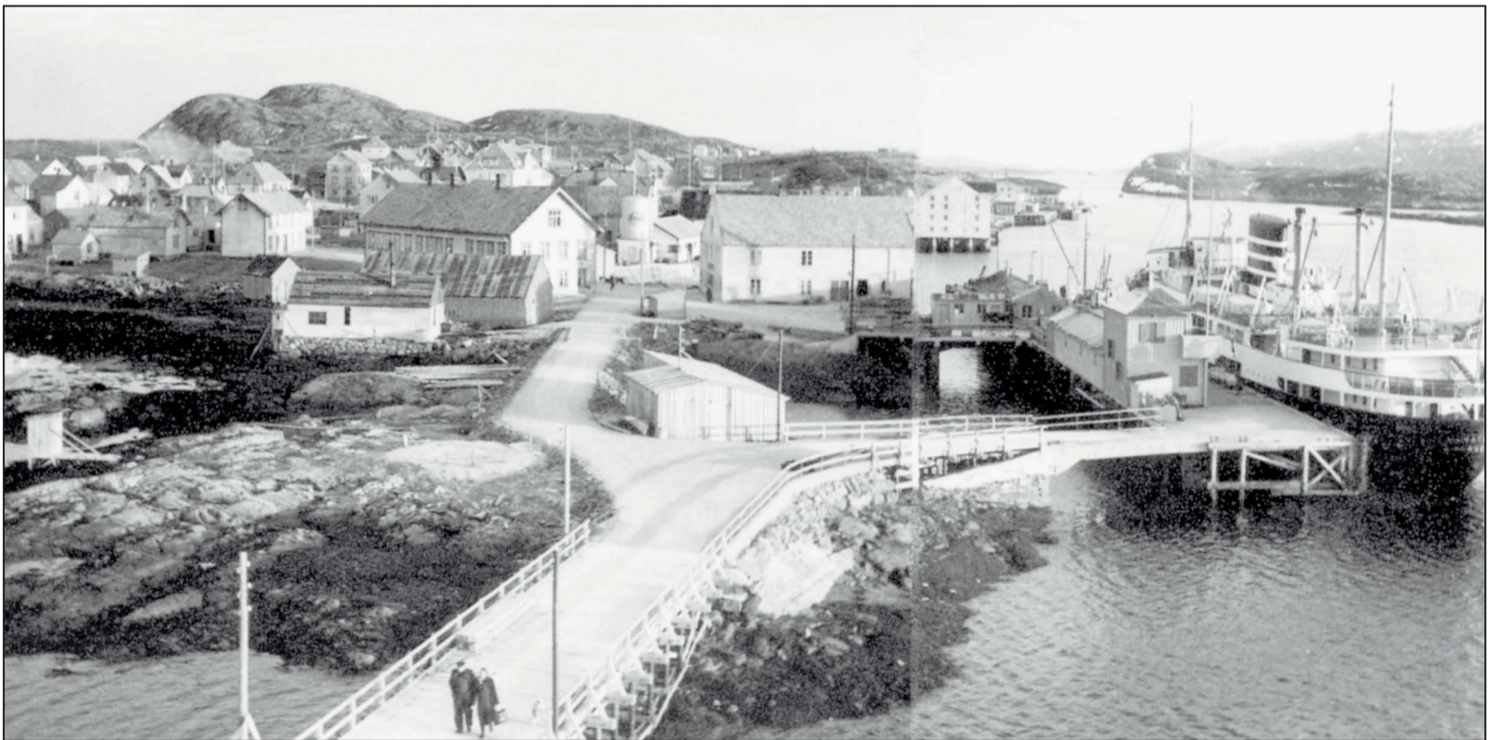
Siden kommunekaia ble bygd i 1920 har den vært sentral i Rørviks liv, ikke bare for kommunikasjonene, men også for det sosiale kveldslivet. Å gå på kaia når hurtigrutene kom og se på turister med lilla hår var spennende for både store og små. Selv om tida er først på 1950-tallet, så fantes det ennå «hus» (på fint kalt for privet) av den sorten som en ser helt til venstre på bildet.