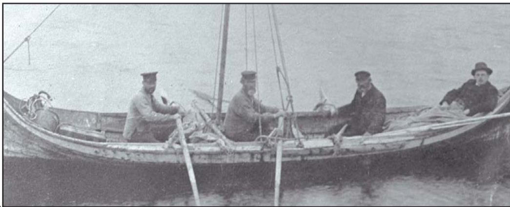
Den gamle skyss-skafferordninga fungerte slik at selveierne innenfor et bestemt område var pliktige til å skyss folk mot betaling. En mann var fast lønnet for å organisere ordninga og holde nødvendig skyssutstyr innenfor hver stasjon.

Rørvik ble slik skyss-stasjon i 1859. Men det var få skysspliktige selveiere på Rørvik og mange som skulle ha båtskyss, og derfor var det stadig problem å få båtskyss her. Etter en del fram og tilbake ble det opprettet en fast skyss-stasjon for båtskyss på Rørvik med tre faste skyssere, og kommunestyret begrunnet dette med økende trafikk.