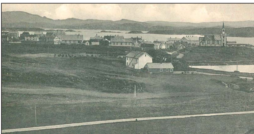
Jordbruksproduksjonen var ganske liten, men allsidig. Alle hadde kyr og sauer, og alle satte poteter og dyrket bygg og havre. Slik var det også på Rørvik som dette bildet tatt fra Svahyllveien ca 1920-tallet viser. Men i tillegg til å være jordbrukere var folk også fiskere. I den offentlige statistikken finner en imidlertid få fiskere, og de oppgitte tallene er ikke korrekte. Feilene skyldes at statistikken ikke hadde noen rubrikk for kombinasjonsbrukere, så folk ble enten klassifisert som fiskere eller jordbrukere.

forskjellene store fordi det bare var menn over 25 år som var selveiere eller leilendinger, som hadde stemmerett. Det betydde eller leilending, som hadde stemmerett. Det betydde bare en svært liten del av befolkningen. Av de 2101 innbyggerne i Nærøy og Vikna i 1845 var det bare 114 som fikk stemme.