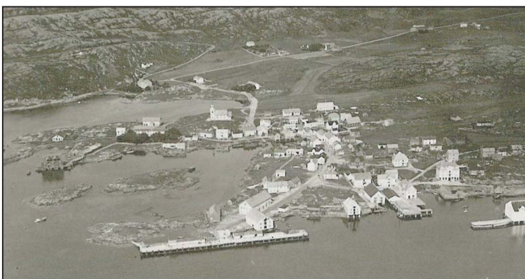
De første menneskene satt trolig sine føtter på Vikna for rundt 10.000 år siden da isen begynte å forsvinne. De aller eldste boplassene er derfor flere tusen år gamle, men den tradisjonelle gårdsbosettinga er imidlertid bare ca 2000 år gammel. Rundt 1350 var det ca 50 såkalte navnegårder i Vikna, men Rørvik var ikke blant dem, og det er uklart hvor lenge før 1500-tallet Rørvik fikk fast gårdsbosetting. Men det er spor etter bosetting her som er rundt 7-8.000 år gamle. Selv om dette bildet er fra 1930, så viser det landskapet slik det var i det gamle Rørvik. Her er ingen områder oppfylt, og bakerst i bildet ser en jordbruksområdet.