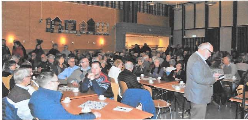
Fullt hus under Vikna kommunes jubileumsmarkering