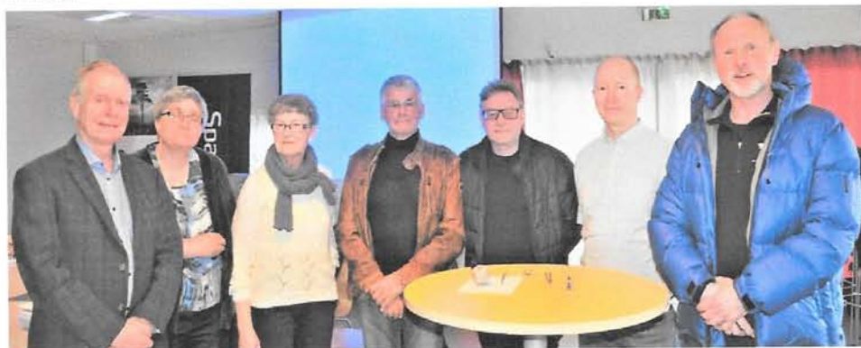
Styret i Namdal historielag samlet til fotografering